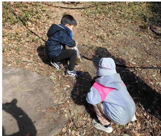
何が落ちているのかな？