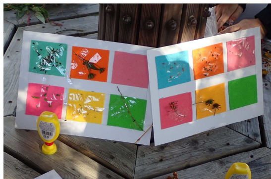
ひっつき虫を貼り付けました