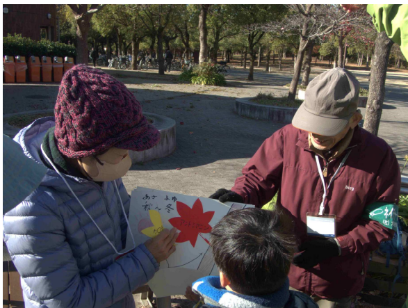
秋になると葉っぱはどうして赤くなるか？

観察内容／大噴水前に集合。木の葉が赤くなったり黄色くなったりする仕組みを説明した後、花の谷で色とりどりの落ち葉やどんぐりを探しました。また、センダングサ、ヒナタノイノコヅチ、アレチヌスビトハギのひっつき虫やガマの穂を見つけました。最後に花棧敷で拾ったひっつき虫や落ち葉を台紙に貼りつけてもらいました。カラフルで個性に満ちた作品ができました。