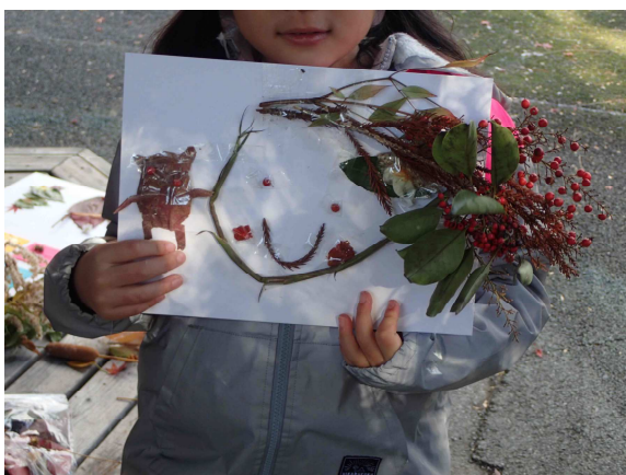
可愛い顔ができた！