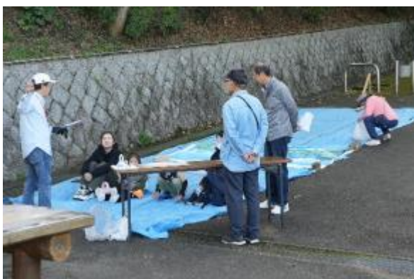
開始挨拶・プログラム案内