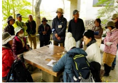
棕ヶ根橋で振り返り