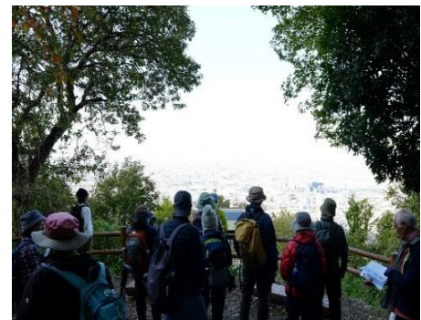
中展望 大阪城見えるかな