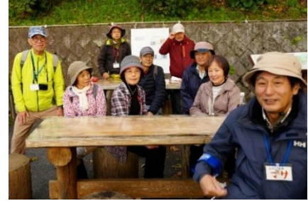
スタッフ振り返り