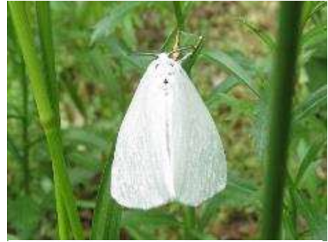
キアシドクガ Wikipedia より