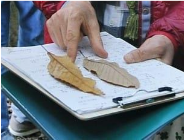
クヌギ・アベマキ葉っぱ比べ