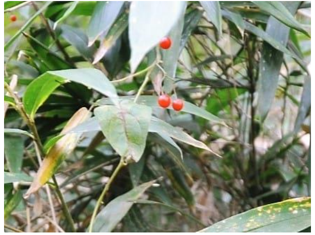
ヒヨドリジョウゴ