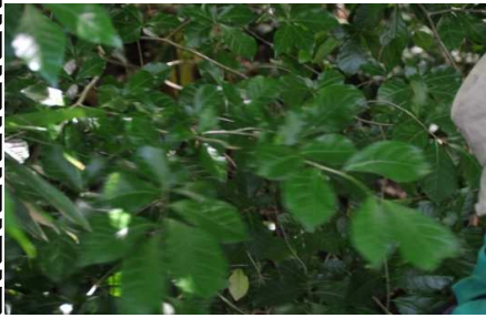
ヤブニッケイ：虫こぶ