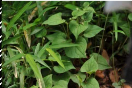
ドクダミの匂いは？