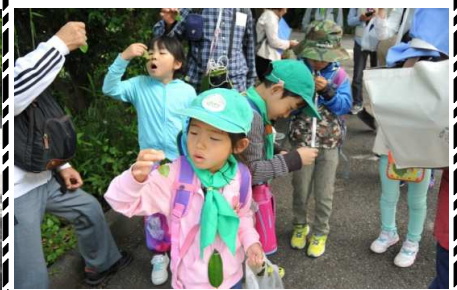
テイカカズラ：カザグルマ