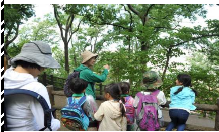
ウツギ(空木・ウノハナ)