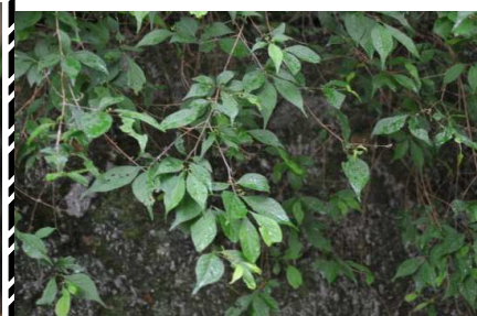
コクサギ型葉序：左右2枚ずつつく