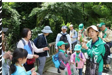
アラカシの葉：恐竜の背びれ