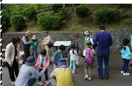
どんぐり集めじゃんけん大会