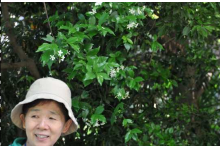
テイカカズラ：白い独特の花びら