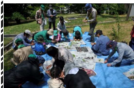
カタバミ：10円玉磨き