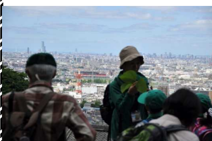
クズの葉てっぼう