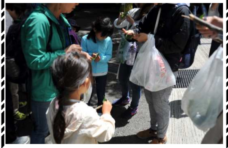
ムクノキの葉：小枝磨き