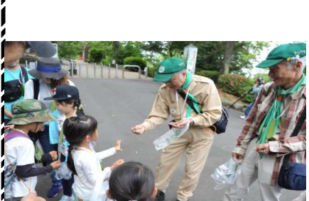
どんぐり集めじゃんけん大会