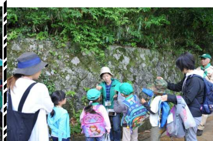
ヤエムグラでペンダント