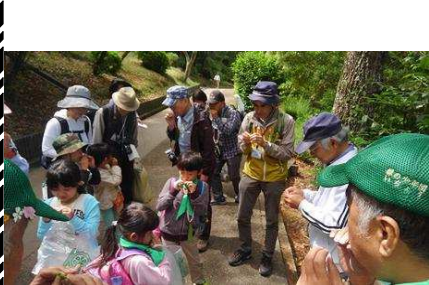
ヤブツバキ:葉っぱ笛