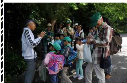
テイカカズラ：カザグルマ