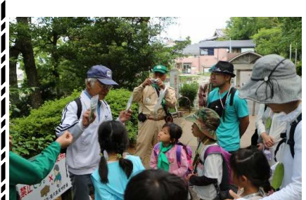
ヤブツバキ:葉っぱ笛