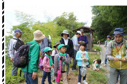
クズの葉てっぼう