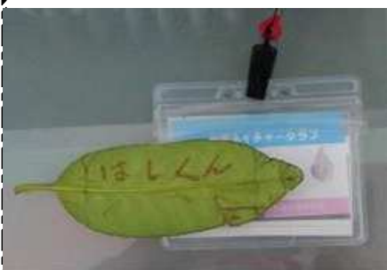
タラヨウ:名札づくり