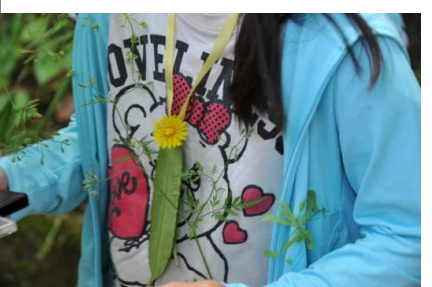
ヤエムグラとオヤブジラミのペンダント