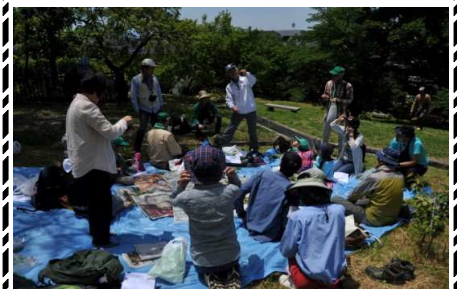
カラスノエンドウ笛