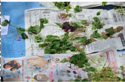
カタバミ：10円玉磨き