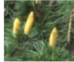
ヒマラヤスギの雌花と雄花