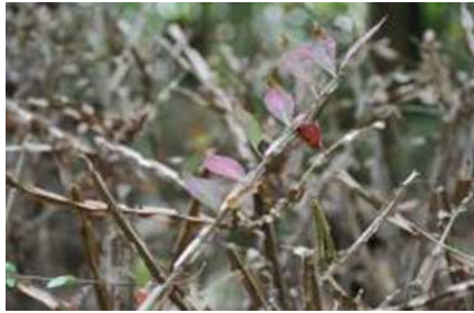
枝につく翼が特徴 13:18 アラカシ