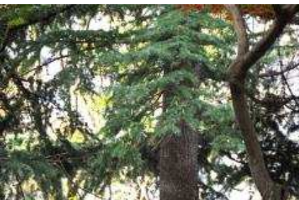
ヒマラヤスギの雄花