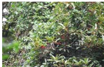
シロダモの実と雌花