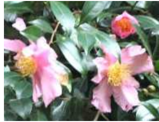
タタラ山のサザンカ