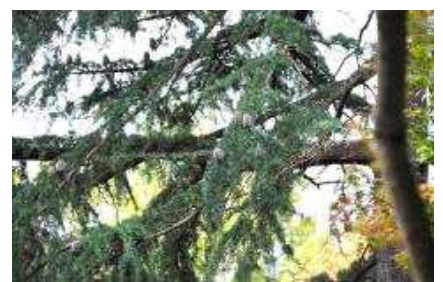
ヒマラヤスギの雌花