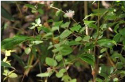
本来春に咲く花 12:24 アラカシ