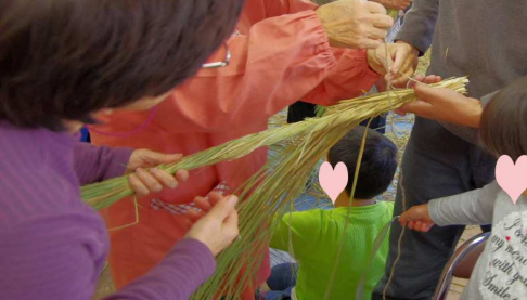
藁の根元を紐でくくる