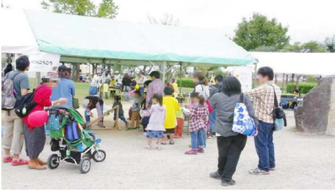
どんぐりころころ・行列風景3