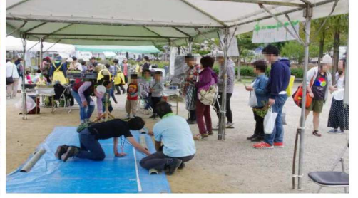
どんぐりころころ・ゲーム風景4