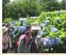
おしよりの観察会

枚岡神社から枚岡公園まで神楽坂コースへ。神楽坂、神楽坂ふれあい広場、タケノ山道を駆け下り、ヤマノボコ、リョウブ(イナ)など木々の花や早春の山野草や昆虫など、観察会します。