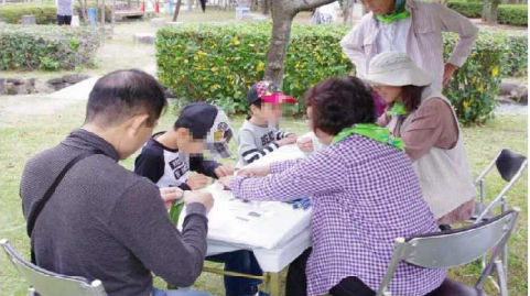
笹船流しテント風景1