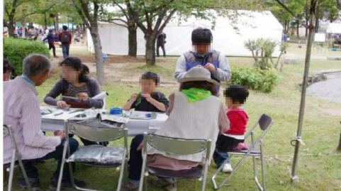
笹船流しテント風景2