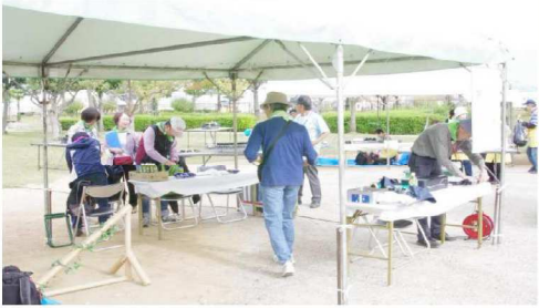
どんぐりころころ準備