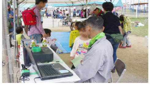
どんぐりころころ・受付風景2