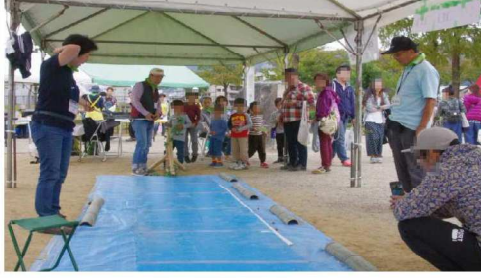
どんぐりころころ・ゲーム風景3