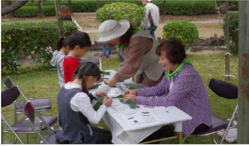
笹船流しテント風景4