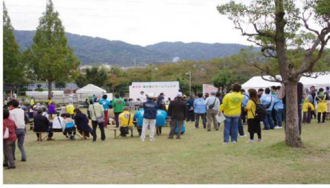
東大阪グリーンフェスタ風景