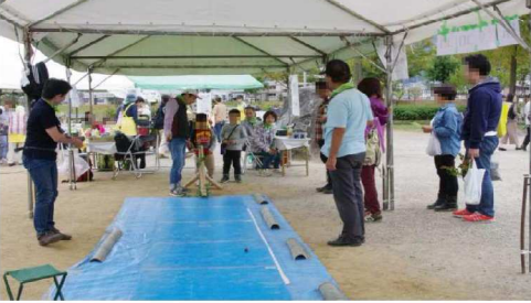
どんぐりころころ・ゲーム風景5