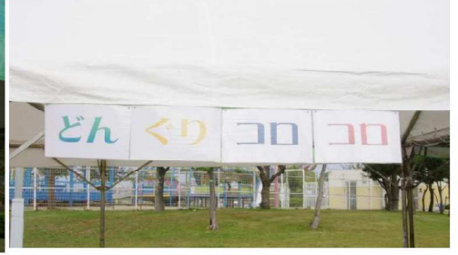
どんぐりころころテント