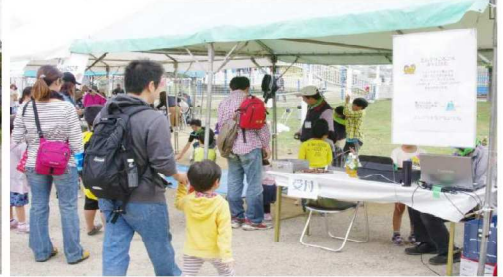
どんぐりころころ・行列風景2