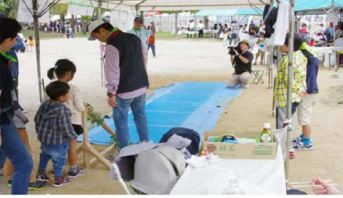
どんぐりころころ ケーブルTVが取材