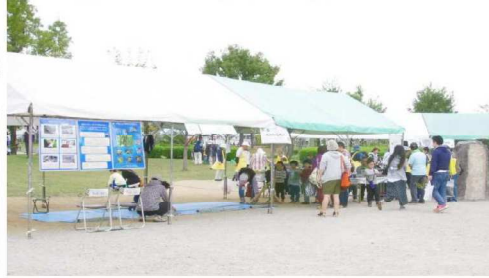
どんぐりころころ・行列風景4