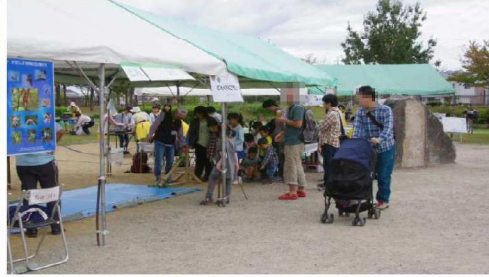
どんぐりころころ・行列風景1