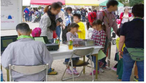
どんぐりころころ・受付風景1