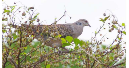
エゴノキの果実を食べるキジバト