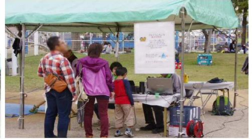
どんぐりころころ・行列風景5