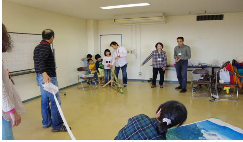
どんぐりころころ2