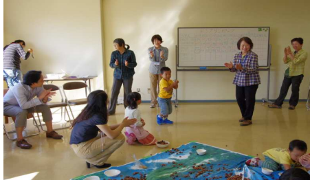
はかってどんぐり9