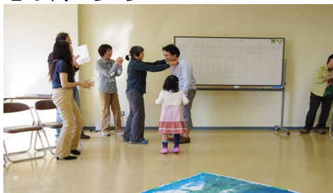
どんぐりころころ11