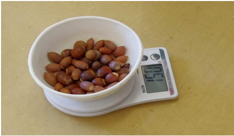
はかってどんぐり5