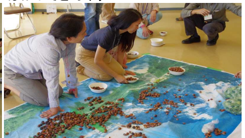
はかってどんぐり1