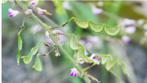
ヌスビトハギ果実の3兄弟(奇形)