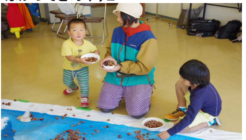
はかってどんぐり2