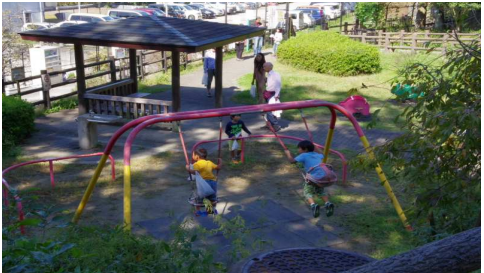
どんぐり拾い帰途2