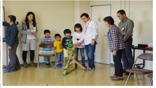
どんぐりころころ3