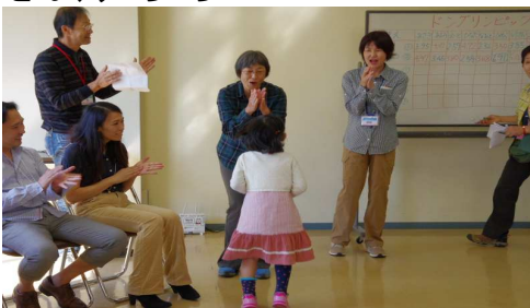
どんぐりころころ10