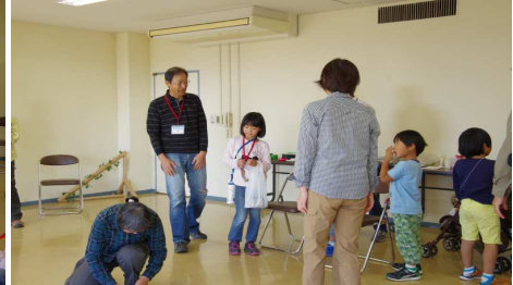
はかってどんぐり10