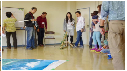
どんぐりころころ6