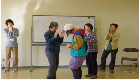
はかってどんぐり8