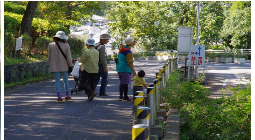
どんぐり拾い帰途1