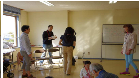
つまんでどんぐり3