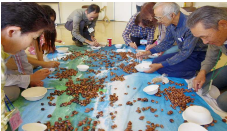
つまんでどんぐり1