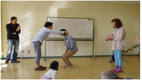
つまんでどんぐり4