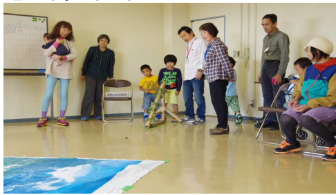
どんぐりころころ8