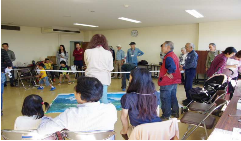
どんぐりころころ1