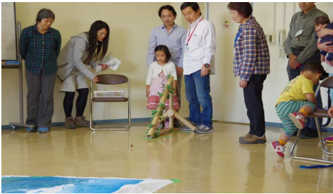
どんぐりころころ4