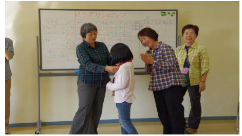
はかってどんぐり7