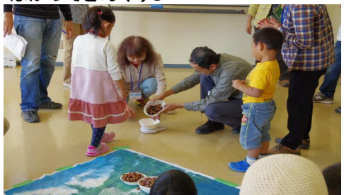
はかってどんぐり3