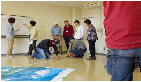
どんぐりころころ7