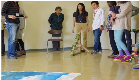
どんぐりころころ5