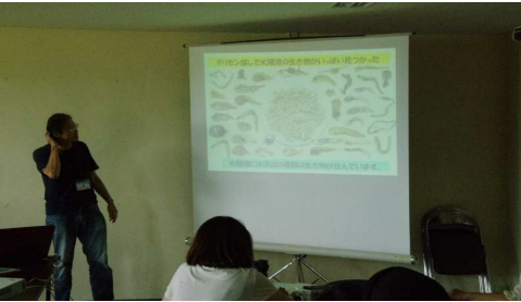
大阪湾の生き物がいっぱい...