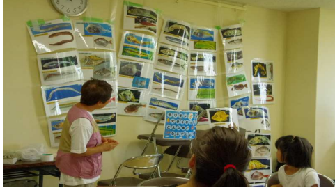
大きくなったらどんな魚になる・・・2