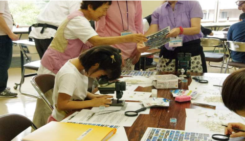
参加者の観察風景10