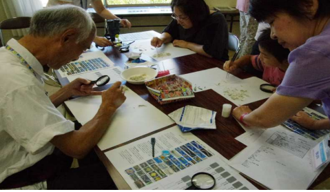
参加者の観察風景4