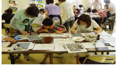
参加者の観察風景6