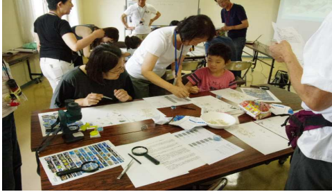
参加者の観察風景8