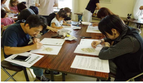
参加者の観察風景2