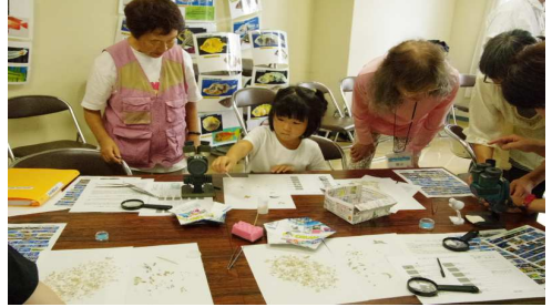
参加者の観察風景9