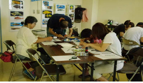
参加者の観察風景1