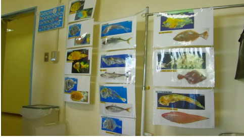
大きくなったらどんな魚になる・・・1