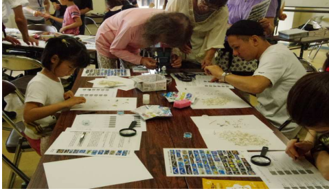
参加者の観察風景5