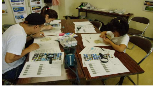
参加者の観察風景3