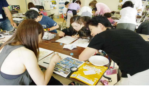
参加者の観察風景7