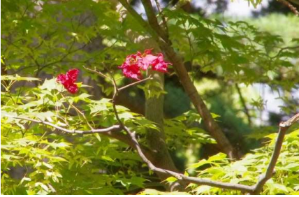
新緑のモミジの中に赤い葉が・・・