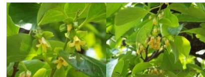
カキノキの雌花と雄花