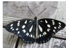
ウィキペディアより