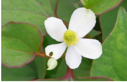
ドクダミの花: 総苞が5枚も