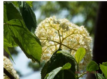
コバノガマズミの花