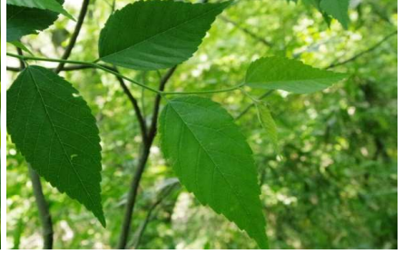
ムクノキ:葉の表に短い剛毛