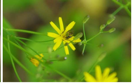
ハナニガナ…花卉が8~11枚