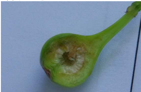
果実は小さなイチジク...