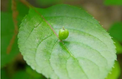
ハナイカダ:雌株:未熟果