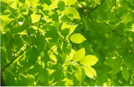
エノキ:若葉と未熟果