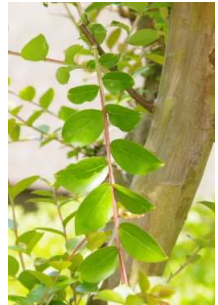
サルスベリ:コクサギ型葉序