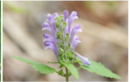
タツナミソウ:背後から