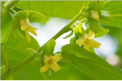
カキノキ:雌花…萼片が大きい