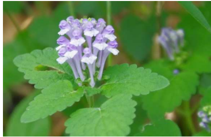
タツナミソウ:正面から