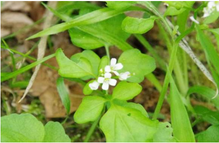
オオバタネツケバナ??