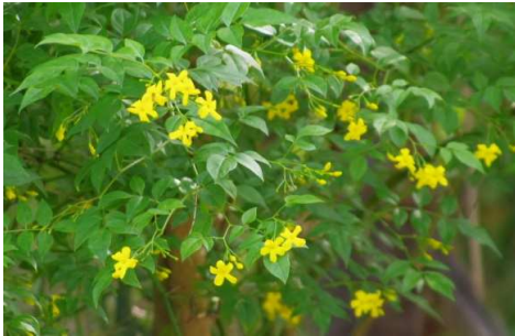
カロライナジャスミン:香り