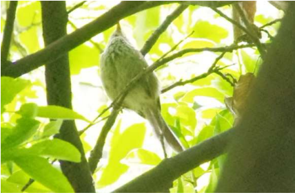
ウグイス…見上げて撮ったので…