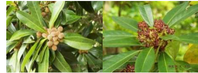
ヤマモモの雌花と雄花