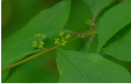
ムラサキシキブ:蕾