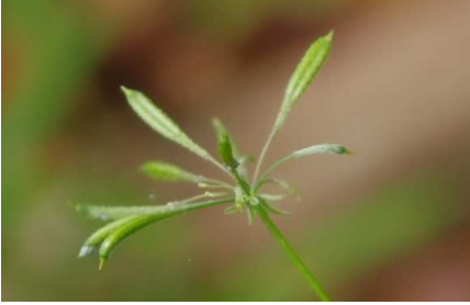
ヤブニンジン: 果実