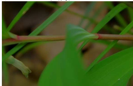
アマドコロ:カク(角)ドコロ!