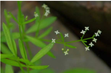
ヒメヨツバムグラ??