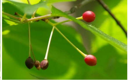
サクランボ:品種名は？