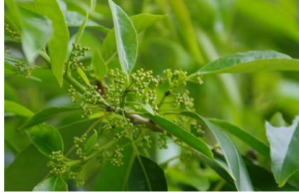
ムクノキ:葉の表に短い剛毛