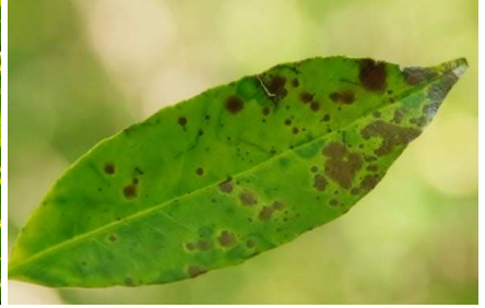
ナナミノキ:まばらに浅い鋸歯