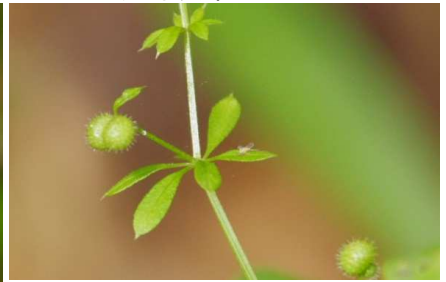
ヤエムグラ:未熟果