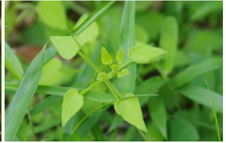
アカネ:花期は8月~9月