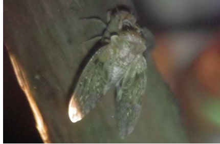
セミ羽化 ニイニイゼミ