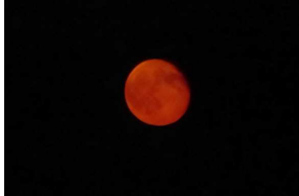
赤い月 居待月 月齢17.1