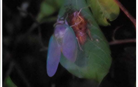
セミ羽化 アブラゼミ?