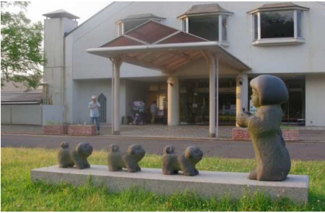
ふれあいセンター前