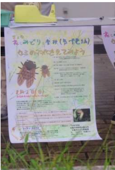
花とみどりの楽校1