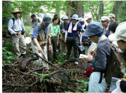
現場で説明を受ける