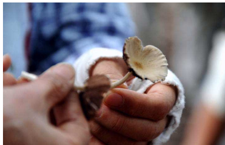
ハラタケ科の仲間