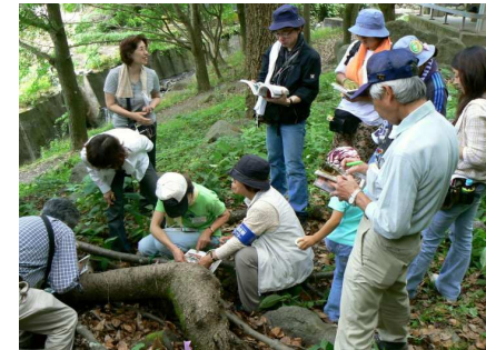
樹木につくキノコも多い