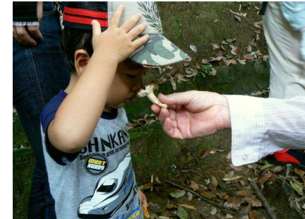
クサハツのにおいは？