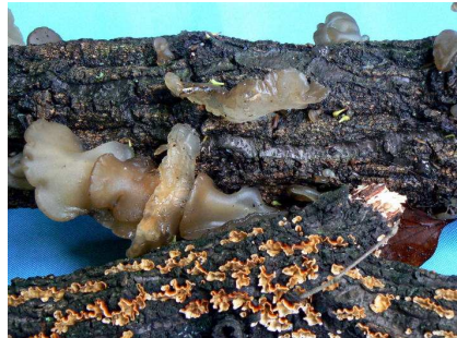
キクラゲ、チウロコタケ