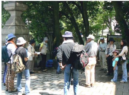
出発前のミーティング