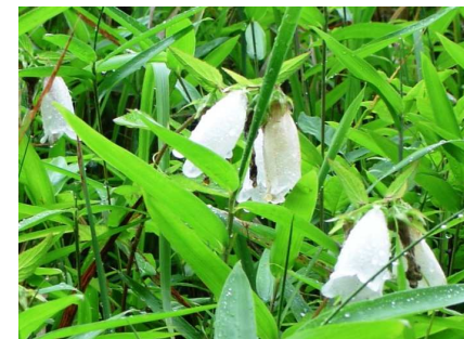
ホタルブクロの季節でもある