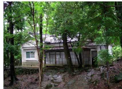
会場の滝寺研修会場