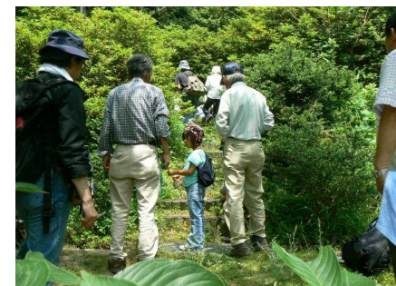
クモタケをさがす参加者