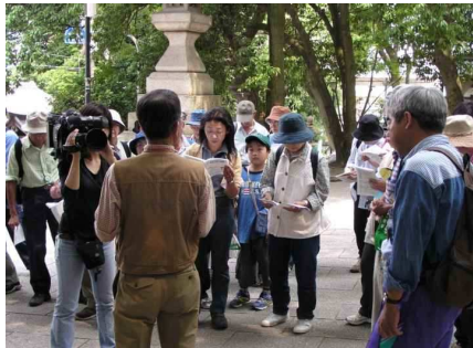
ケーブルTVも活動状況を取材