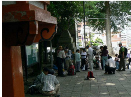
いつもの出発地で集合