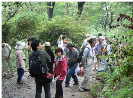
あっちこっちを探す