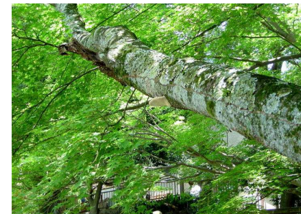
サルノコシカケの仲間