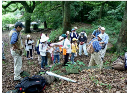
さあ、キノコを探そう