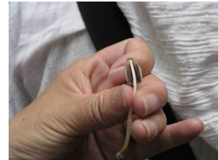
ヒトヨタケの仲間の解剖