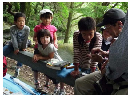
興味深く見つめる