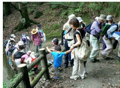
階段の上下にも発見