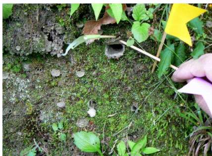
クモタケの蓋付巣穴群