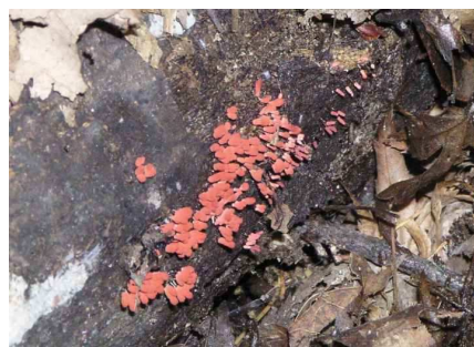
アカカミノケホコリ