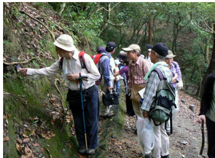
斜面はクモタケの巣箱