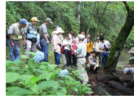
腐食菌について説明