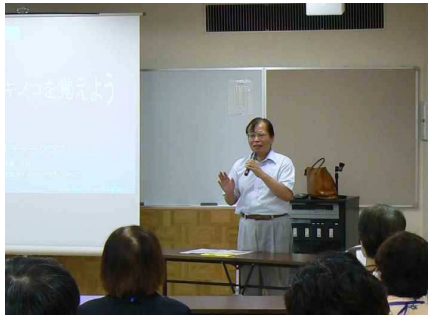
事務局長のあいさつ