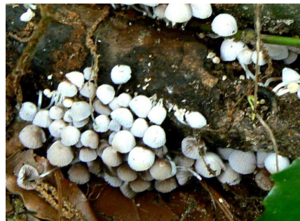
イヌセンボンタケ