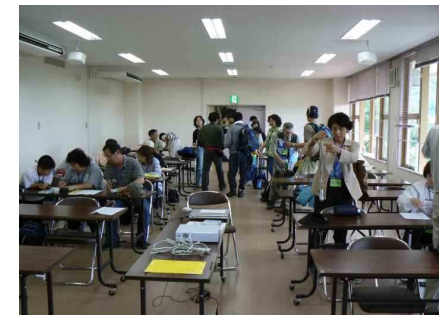
行事を終えて解散