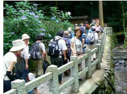
イスノキを見に登る