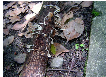
アシナガイタチタケ