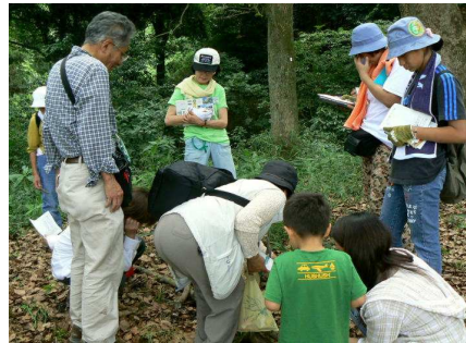
なにやら見つかった