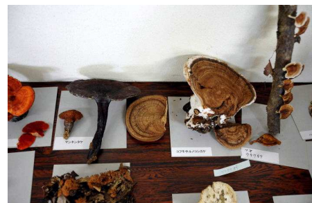
サルノコシカケの仲間が多い