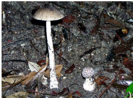
テングツルタケ・テングタケ