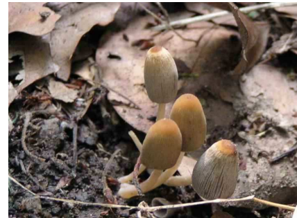
ヒトヨタケのなかま