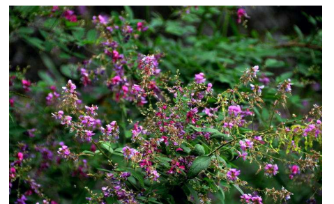
アレチヌスビトハギ