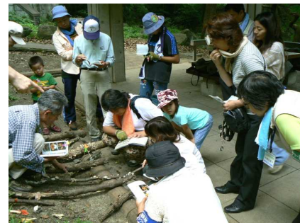
図鑑を片手に同定作業