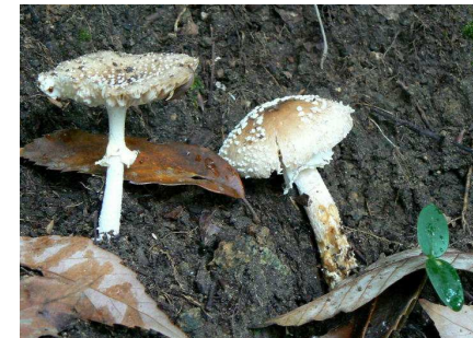
テングタケダマシ