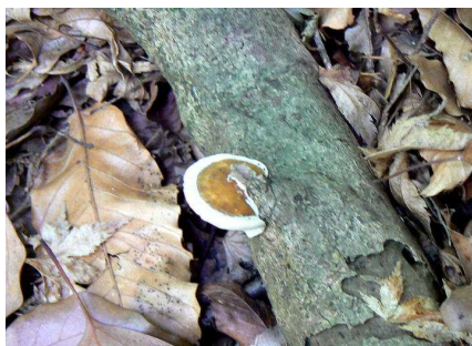
ツガサルノコシカケ