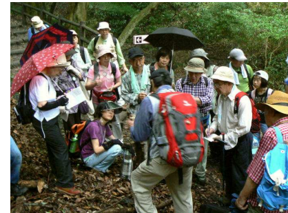
現地で説明を受ける