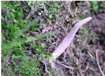
クモタケ(トタテグモに寄生)