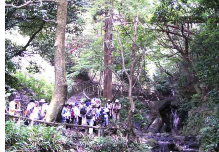
涼しい谷筋の観察