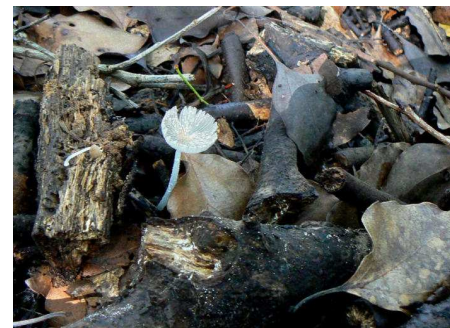
サラエノヒトヨタケ