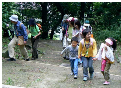
ヨイシヨ、少し上だね