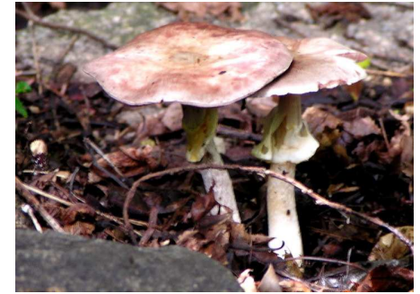
ナカグロモリノカサ