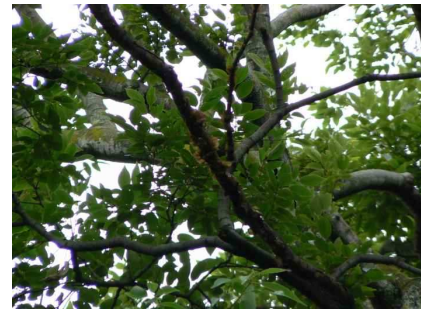
頭の上にキクラゲが