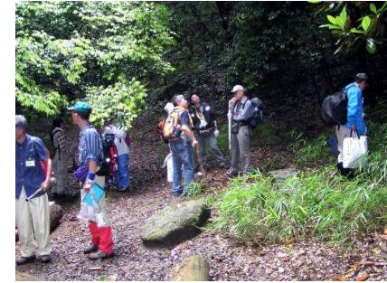
チョット一服、そこでもさがす