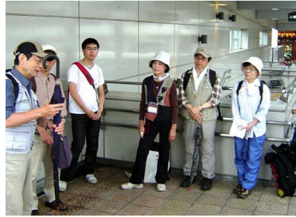
傘をキノコにみたてて説明