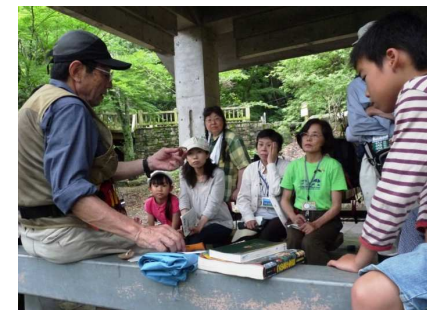
真剣に聞くキノコの話