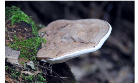
コフキサルノコシカケ