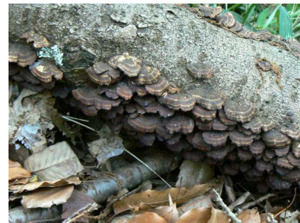
サルノコシカケ類の・・・