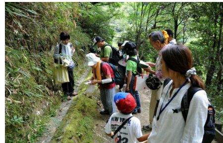
山のり面にはキノコが多い