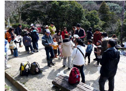
桜広場で今日のまとめ