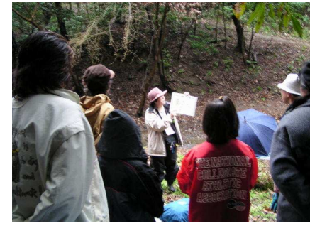
水中生物を図で説明