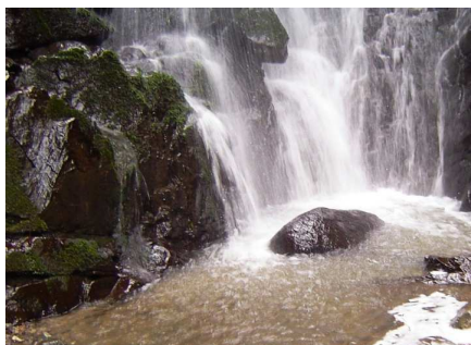
水流が多い滝つぼ