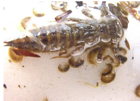
コミボソヤンマ(ヤゴ)