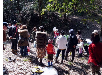
観察時の注意を受ける