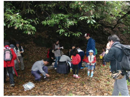
荷物を置きさあ川へ