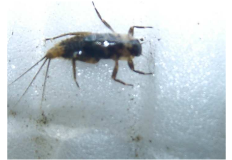
クロマダラカゲロウ