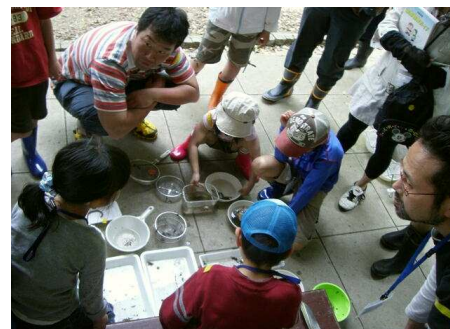
講師の話にみな真剣