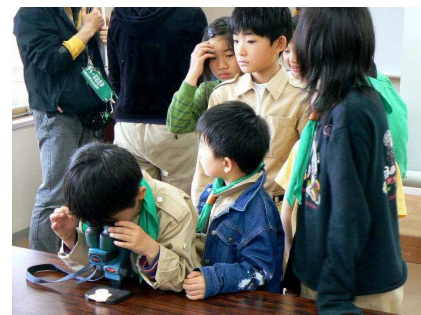
室内で顕微鏡を見る