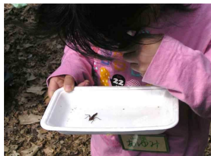
虫眼鏡でチェック