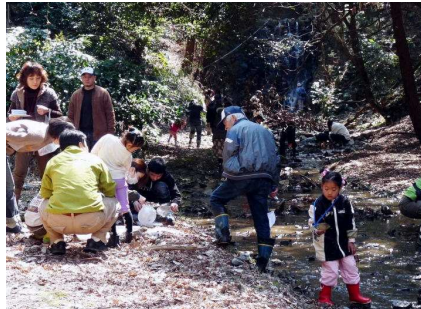
思い思いに観察を