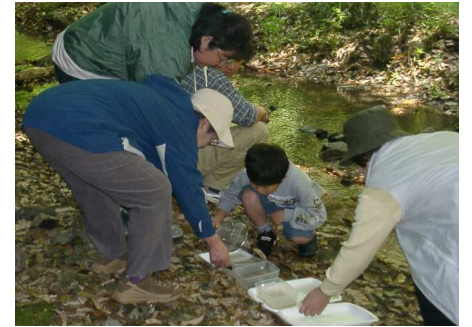
なにが取れたかな