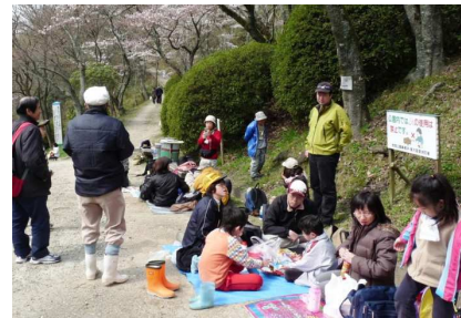
桜の花の下で昼食