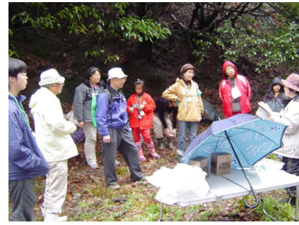
観察の要点を説明