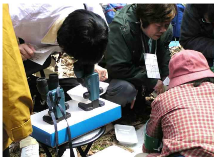
より細かく観察する