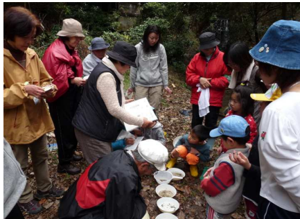
テキストを見てください