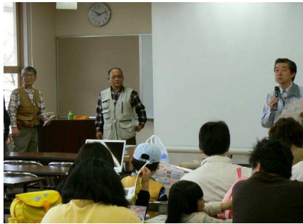
館長の開会あいさつ