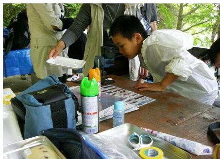
顕微鏡ではどんなかなあ