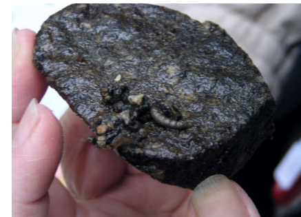
川の蓑の虫 トビケラ