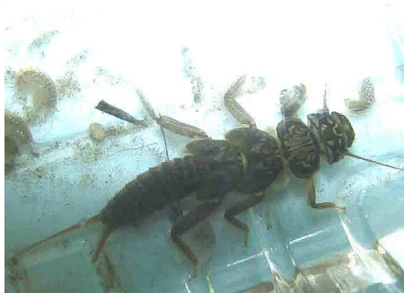
オオヤマカゲロウ