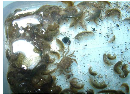
ヨコエビ・サワガニ