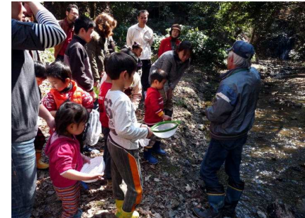
注意して川に入ってよ