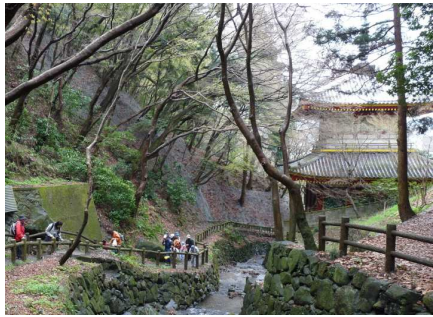
豊浦川に沿って上がる