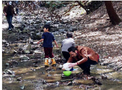
お父さんガンバル