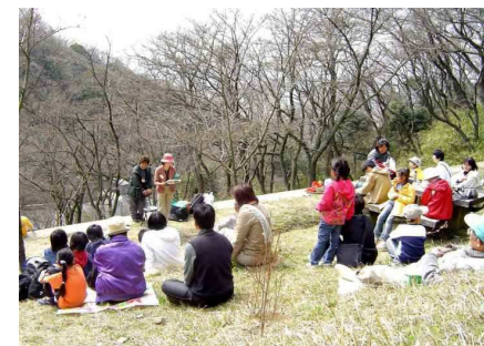
川の話と皆さんと