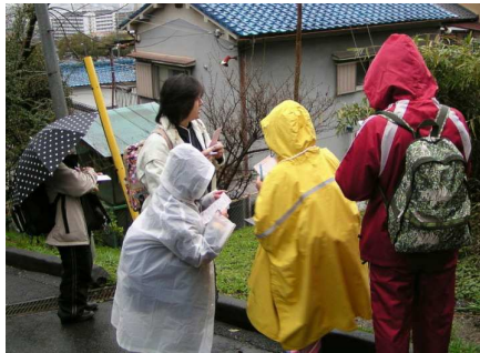
雨の中を観察地へ