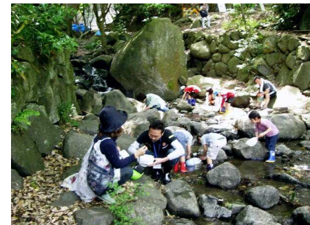
これカメラで撮るよ