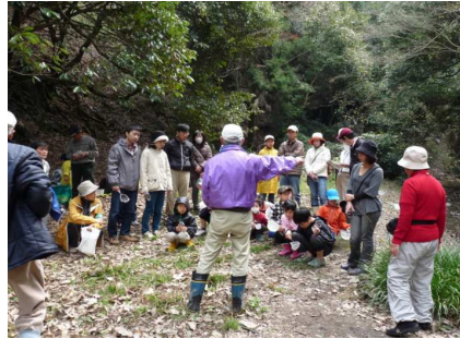
採取の注意事項説明