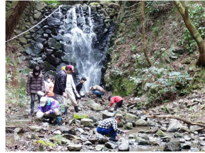
何かいるかな・・・