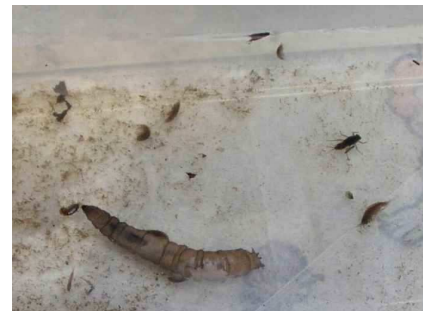
ガガンボやヨコエビ