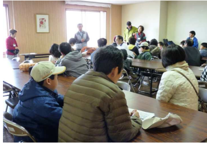
グリーンガーデン枚岡で開会