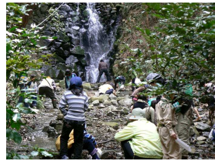
滝近くがいいかな