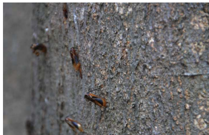
ヒラアシキバチ死骸