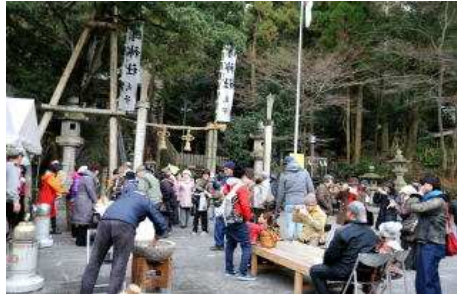
枚岡神社の餅つき