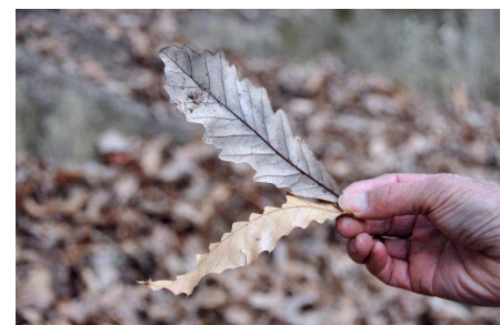
上クヌギ 下アベマキ