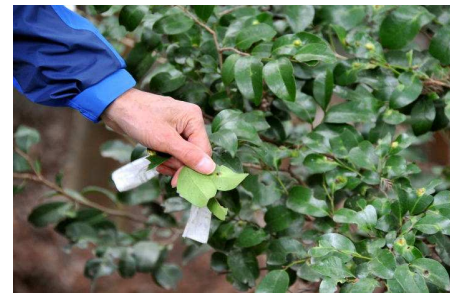
イスノキの虫こぶ