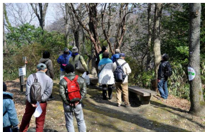
シャシャンボは幹の荒れが特徴