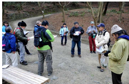
今日のまとめをして解散