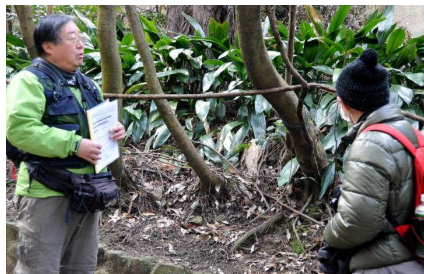
ハランの花粉媒介者は誰