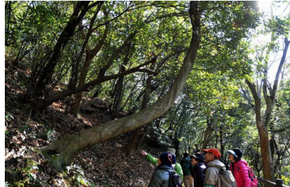
傾木を根が支えている