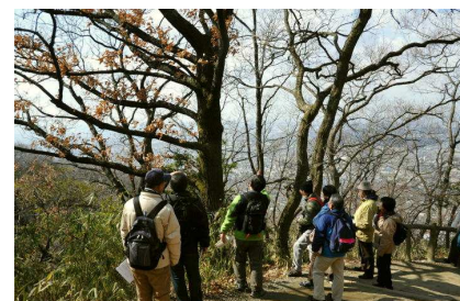
クヌギの葉が残っている