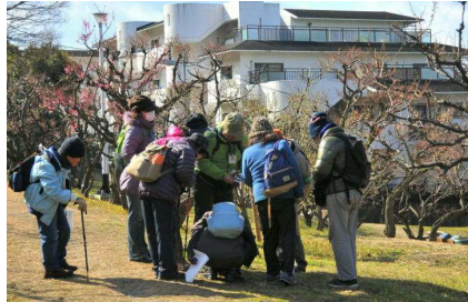
まだ少し早い観梅